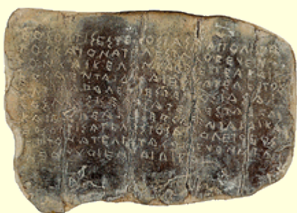
Tablette de défixion en grec dorique, Sicile, 5e siècle av. J.-C.

Dans le monde gréco-romain, les tablettes de défixion ( defixio en latin, καταδεσμος - katádesmos - en grec), appelées aussi tablettes d'exécration ou tablettes d'envoûtement, sont des feuilles de plomb roulées, pliées ou clouées, qui portent des inscriptions et signes supposés envoûter la personne dont le nom est inscrit, en lui promettant de dures épreuves.