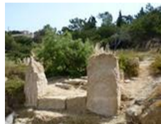
Ceci est-il un site à signaler? (vestige de porte, plage d'Egine)

Un long travail de compilation commence, à partir de sites et sources diverses n'utilisant souvent que la langue originale du pays, parfois l'anglais. Il faut trier aussi: jusqu'où faut-il aller? Mentionner trois pierres isolées qui ne parleront qu'aux professionnels?