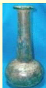
Un verre romain, sans doute faux.