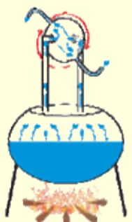
L'éolipyle, première turbine à vapeur.