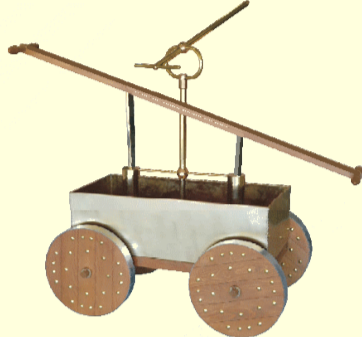
Cette pompe à incendie antique ressemble à s'y méprendre à celles du 19e siècle

Connaissant nos technologies actuelles, on s'émerveillera de constater que la plupart des composants de nos systèmes mécaniques d'aujourd'hui (vis, écrous, engrenages, chaînes de transmission, soupapes et cylindres hydrauliques, mécanismes articulés) existaient déjà il y a deux mille ans.