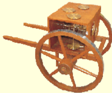
Cet odomètre indique, grâce à une boîte d'engrenages, le chemin parcouru.

◆ Comme les Grecs et les Romains connaissaient l'odomètre (un dispositif à plusieurs étages de roues dentées mesurant la longueur de trajets en pieds et en milles) et des mécanismes aussi incroyablement complexes que la machine d'Anticythère, pourquoi n'ont-ils pas inventé la machine à calculer?